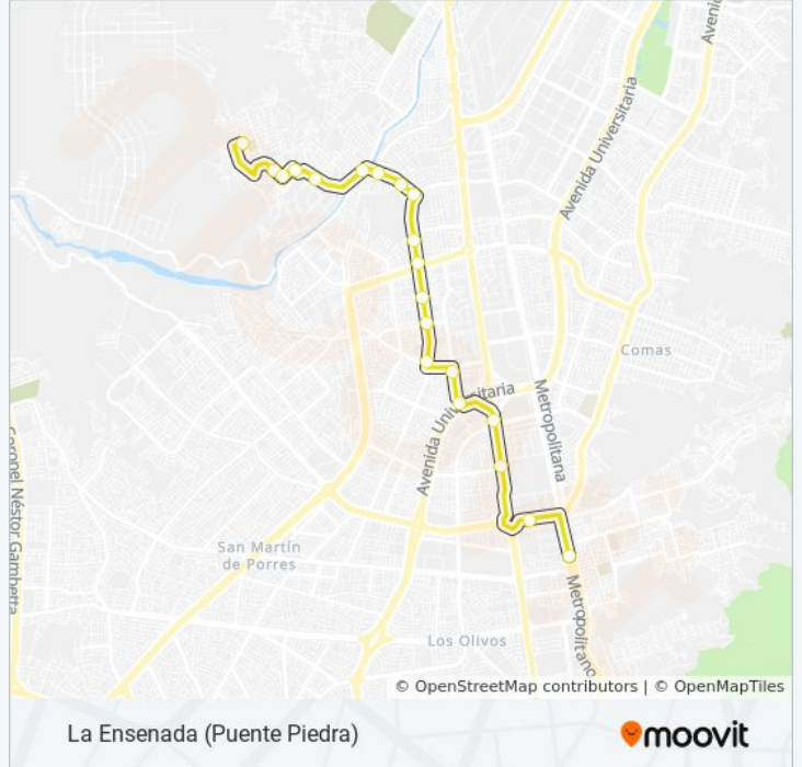
La Ensenada (Puente Piedra)