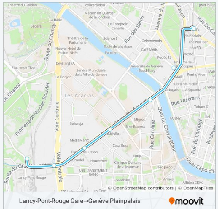
Lancy-Pont-Rouge Gare→Genève Plainpalais